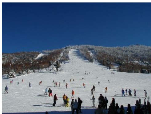
ファミリースキー場