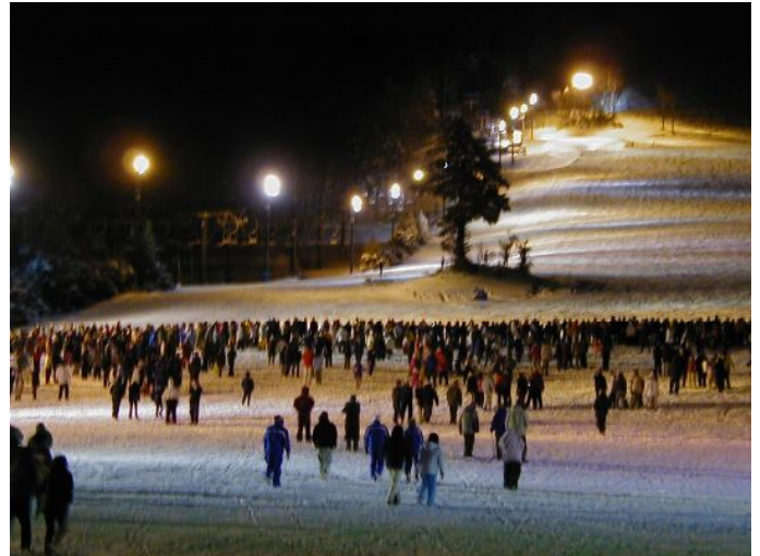
ファミリースキー場内一の瀬神社での2年参りの列(左端が神社)