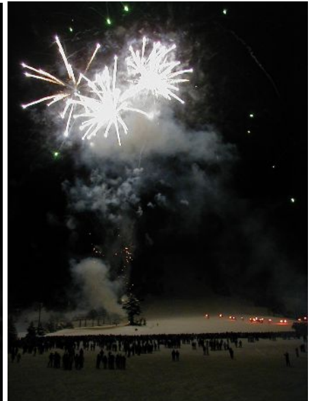
1月1日午前0時、花火ナイアガラと松明滑走打ち上げ花火の様子